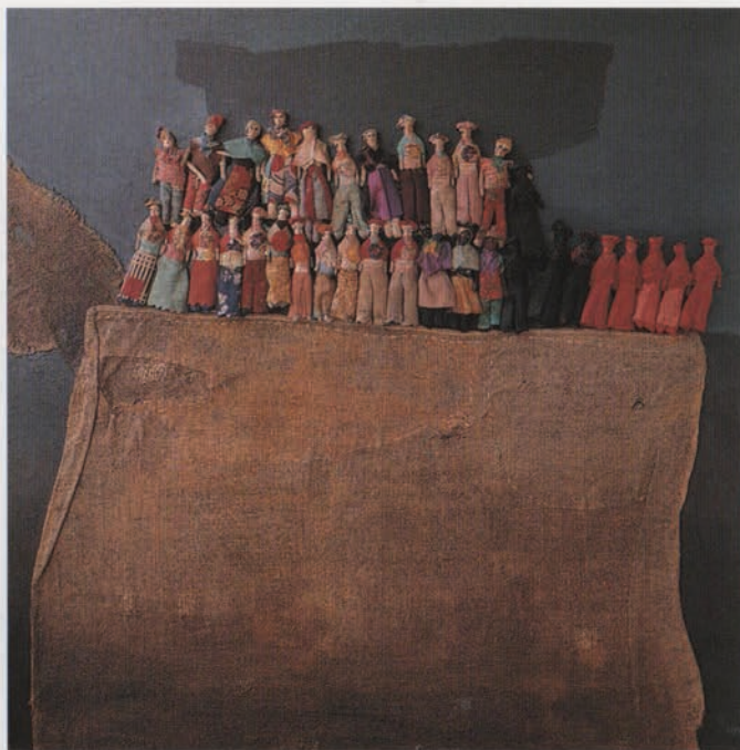
OSWALDO VITERI PINTOR LATINOAMERICANO

Viteri nace en 1931. Su vocación le lleva a experimentar en la pintura iniciándose con el dibujo figurativo, con lo cual, realiza su primera exposición en 1957.